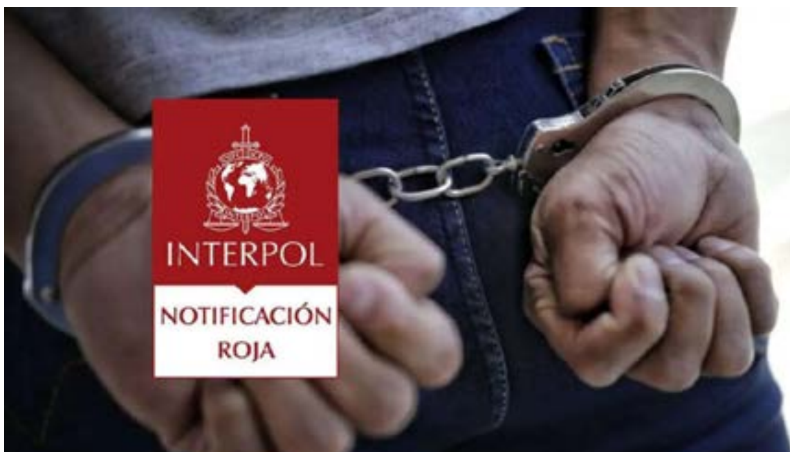
Con la emisión de la circular roja, el paradero de Marín se convierte en una prioridad para las autoridades de los 196 países miembros de la Interpol.

La Fiscalía General de la Nación ha elevado la búsqueda de Diego Marín, conocido en el mundo del crimen como alias 'Papá Pitufo', a nivel global. El organismo ha solicitado a la Interpol la emisión de una circular roja con máxima difusión para localizar y capturar al hombre señalado de liderar una de las redes de contrabando más complejas y lucrativas del país.