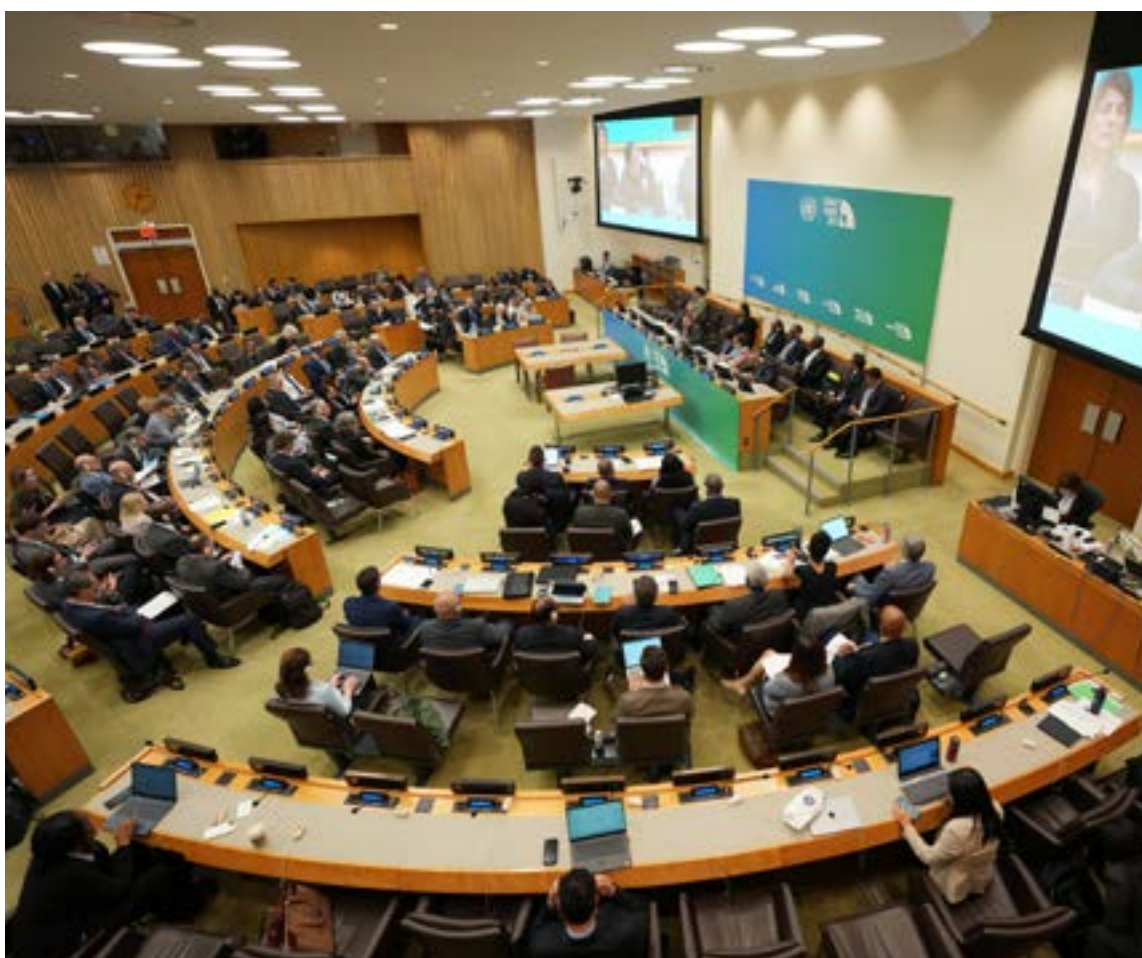
Petro arremetió contra lo que considera una doble moral de la administración estadounidense.

alinee con los intereses norteamericanos.