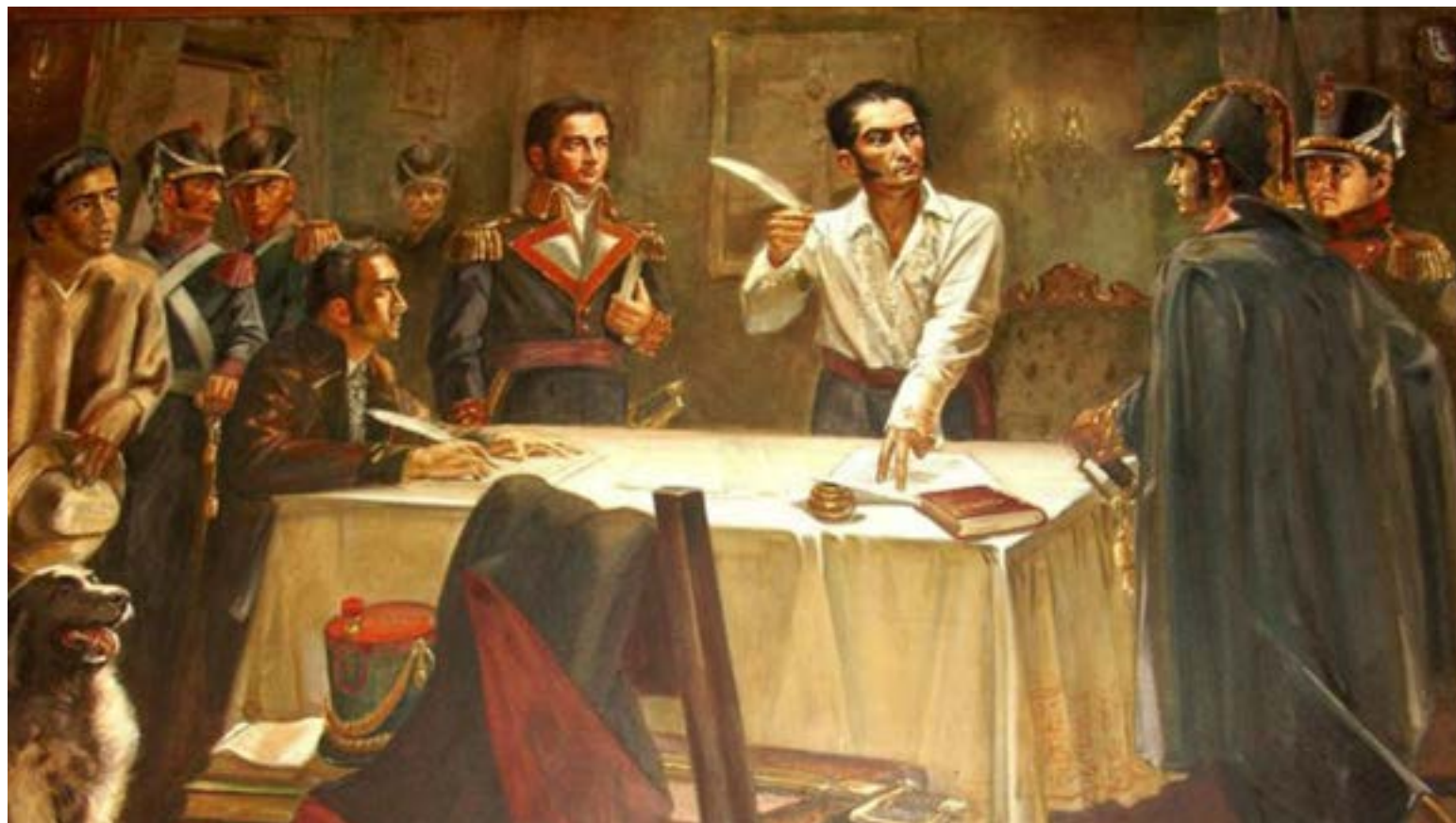
Simón Bolívar en magas de camisa