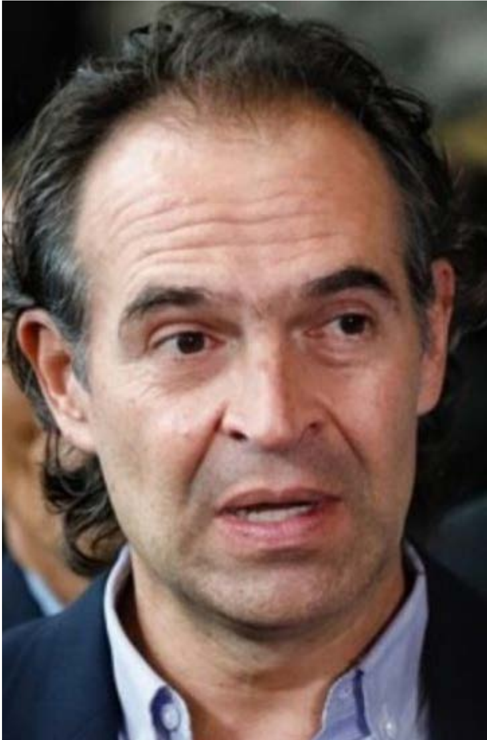
Federico Gutiérrez, alcalde de Medellín

Federico Gutiérrez asume la presidencia de Asocapitales. Galán termina apoyando a su rival.