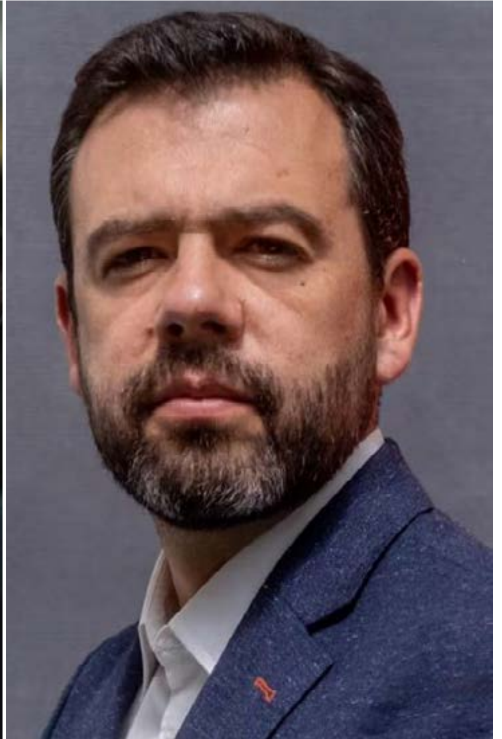
Carlos Fernando Galán, alcalde de Bogotá