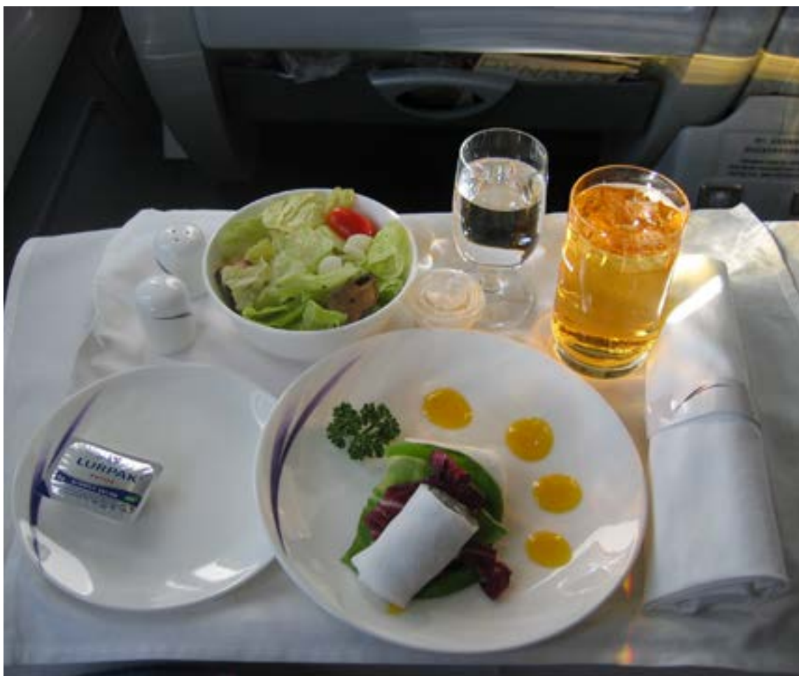
Entremés servido a las pasajeros de clase business por China Airlines.

El resultado fue que a excepción del umami (sabroso), en las alturas