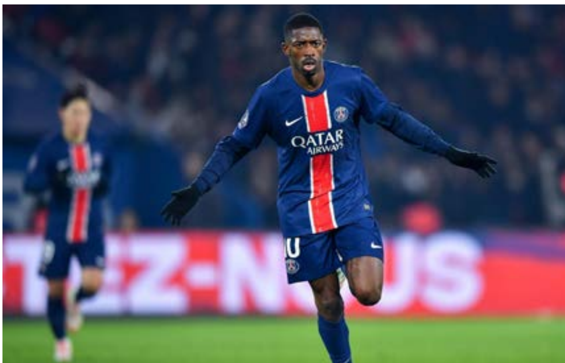
¡Es el mejor del mundo! Ousmane Dembélé es el Balón de Oro 2025 y el planeta a sus pies, cantaban los hinchas del El Paris Saint-Germain

Trofeo al Club del Año (Masculino): El Paris Saint-Germain.