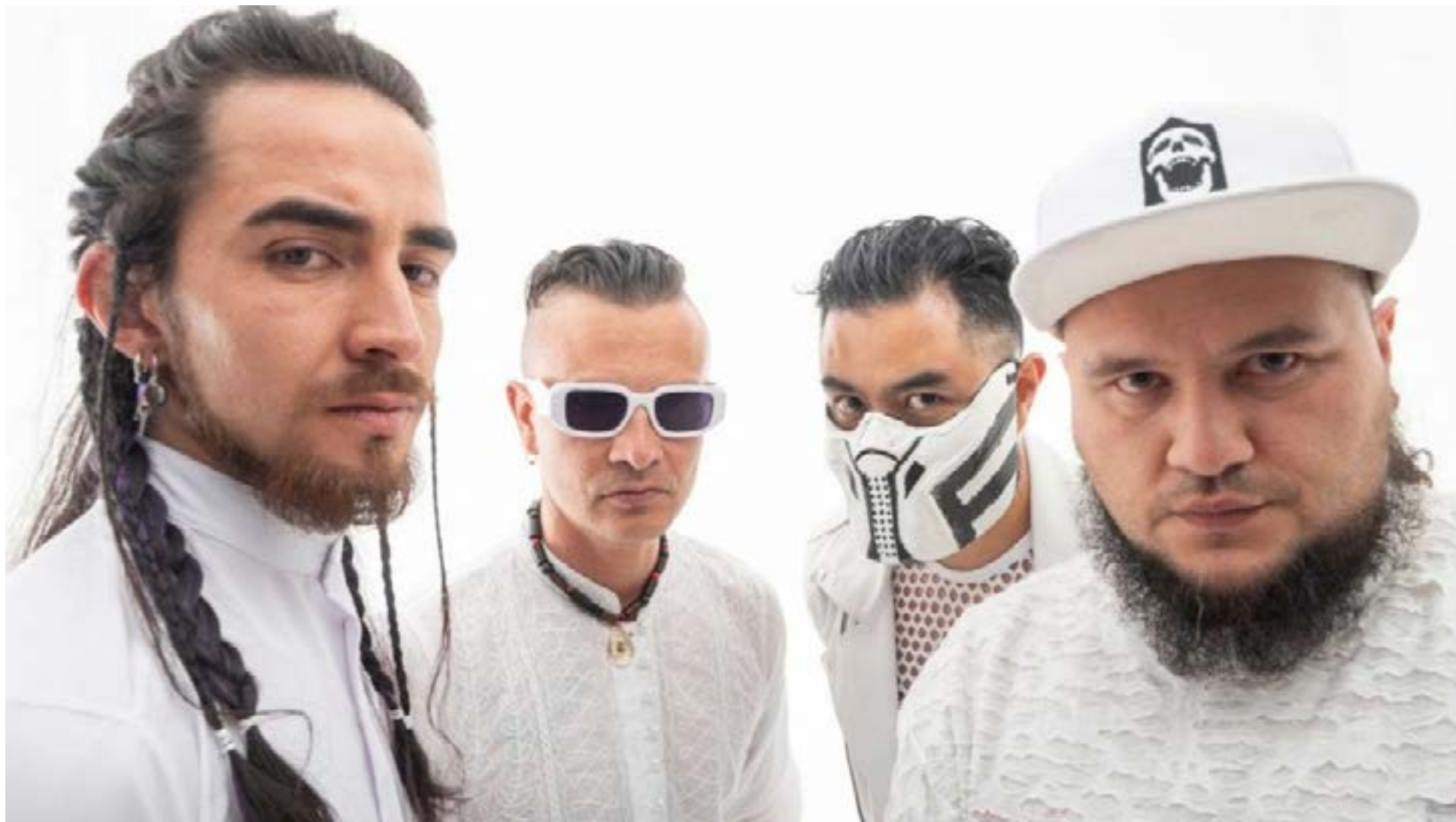
La banda Narcocracia