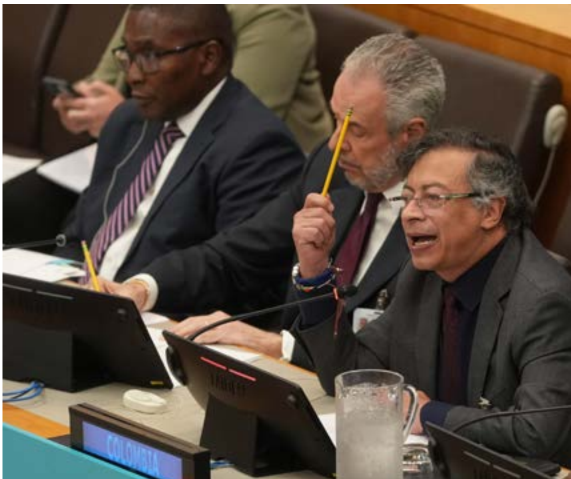
Gustavo Petro Urrego, presidente de Colombia

En un acto público, Petro arremetió contra lo que considera una doble moral de la administración estadounidense. Por un lado, criticó duramente a Washington por su inacción en el conflicto palestino-israelí, específicamente por no apoyar un cese al fuego en el Consejo de Seguridad de la ONU. Para el presidente colombiano, la falta de apoyo de EE. UU. a los derechos humanos en Gaza revela una hipocresía en su política exterior. Por otro lado, el mandatario colombiano hizo una mención velada a una operación militar en el mar Caribe, calificándola de «agresión». Aunque no dio mayores detalles, sus palabras se interpretaron como una clara protesta ante la presencia de embarcaciones y personal militar de Estados Unidos en la región, un despliegue que, según su lectura, busca presionar a Colombia para que se