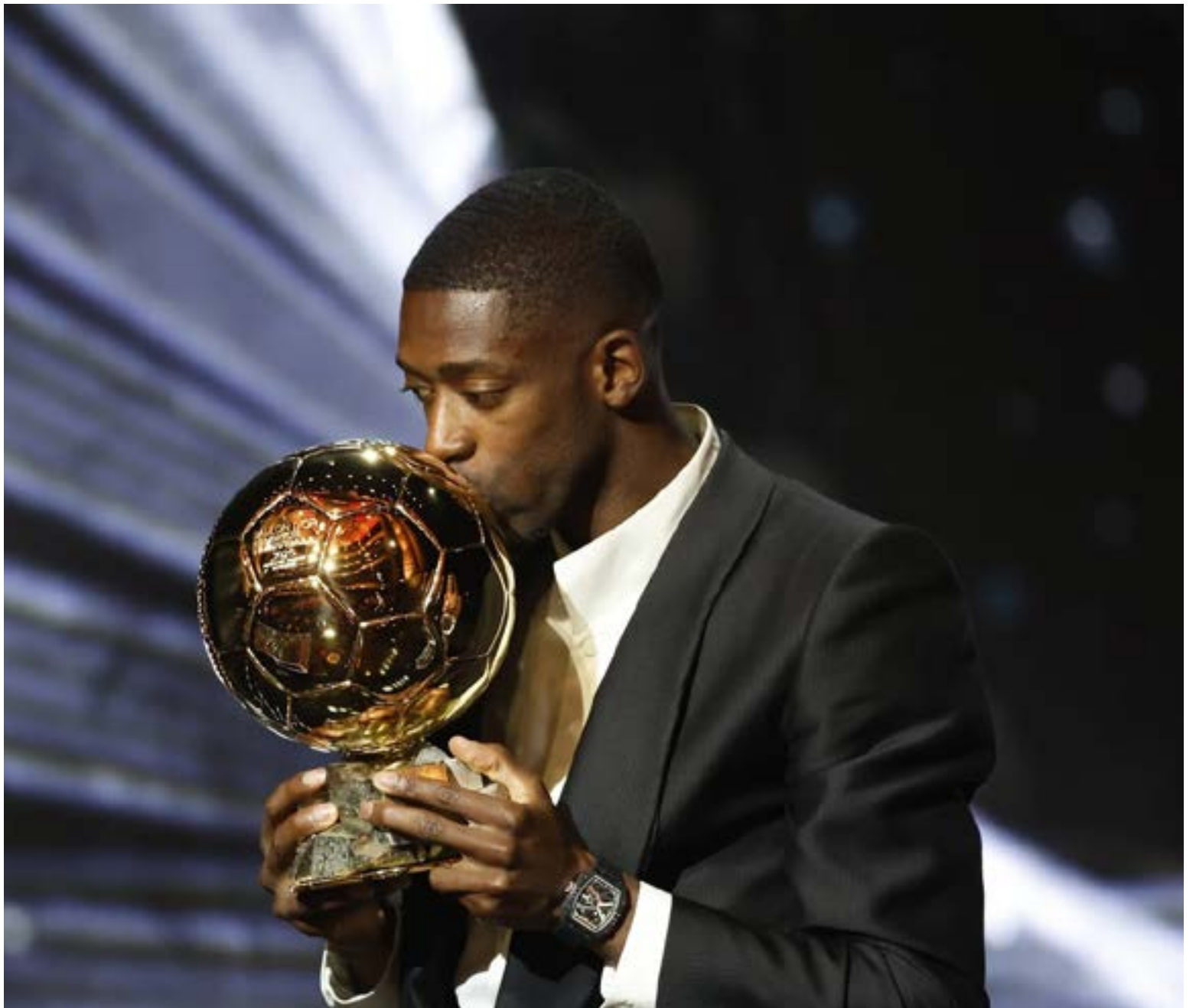
Ousmane Dembélé a sus 28 años, en su primera nominación se lleva el Balón de oro edición 2025.

Trofeo Yashin (Mejor portero): El italiano Gianluigi Donnarumma, compañero de Dembélé en el PSG.