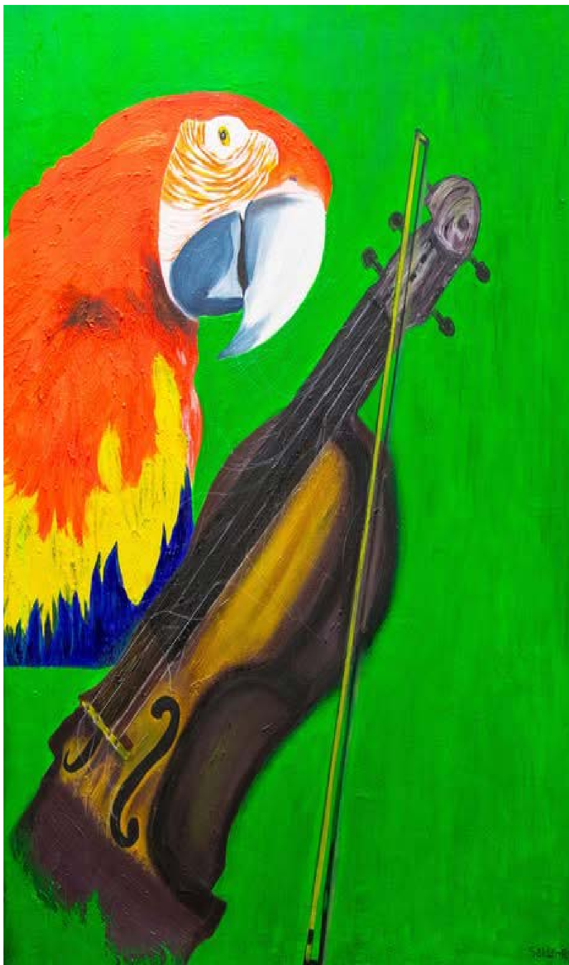
«El papagayo tocaba violín»

En esta nueva narración, Gardeazábal se enfrentó al reto de desenredar aquello que el tiempo y la vida habían ido enredando en más de cien años de historia familiar. Con una estructura que imita al azar, pero acomodando las historias con la destreza de un prestidigitador, el autor decidió que los recursos narrativos no se desprendieran de la trama, sino de la vida misma. El libro es una explosión de historias, donde se hilvanan personajes de todo tipo: monjas, curas, alcaldes, enanas, gigantes, sexo, envidias, amores correspondidos, ultrajes y ahorcados. Cada capítulo podría desprender una nueva novela, como en el caso del número once, que narra la apasionada historia de Raquel y Matilde, un capítulo que destaca por su poesía y humanidad. Uno de los aciertos más notables de la obra es la forma en que el autor se desmarca de los recursos